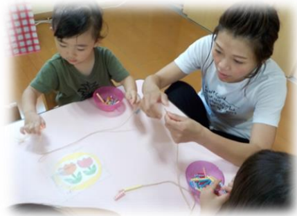
／ 紐にストローをたくさん通していきます。集中力は日に日についています！

園では保護者が一緒に保育に参加し、子どもたちや保育士の様子を知ってもらう「保育参加」を実施しています。参加された方からは「お友だちとかかわっている姿を見て、ほのぼのした。」「保育士さんって、大変だな。」とか、給食も一緒に食べるので「家では嫌がって食べない野菜も、保育園では頑張っているんだな。」と、普段見えなかった子どもたちや保育士の姿に、喜びや驚きなど様々な感想を寄せてくれました。