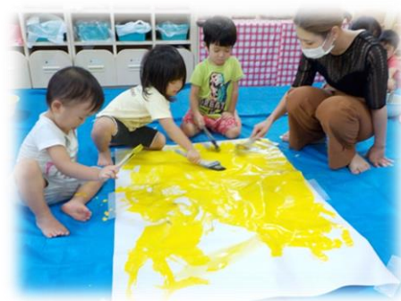
／ お母さんと一緒にぬたくりあそび