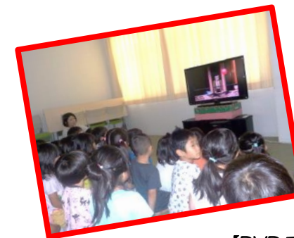
【DVD でや絵本で戦争や平和を学びました。】