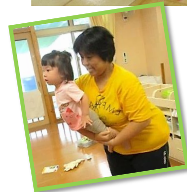
【ひこうきぶんぶん♪】

歩行ができるようになって、園ではあそびの中で「這う運動」を積極的にすすめています。這うことは体幹を鍛えるだけでなく手指の器用さと深くかかわっています。また手指をつかさどる脳の部分は言語野に隣接しているので「ことば」の発達にもかかわりがあります。♪「ひこうきぶんぶん～」の歌に合わせて大人が下半身を支え、こどもが上半身を反るあそびは楽しみながら体幹を鍛えることができます。