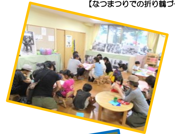
【なつまつりでの折り鶴づくり】