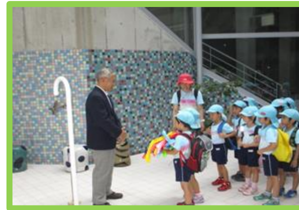
【ピースおおさかに千羽鶴を届けました。】

DVD や絵本、パネル展示を通して「戦争は怖い…」「したらあかん」など戦争の怖さを知る一方、子どもたちなりに平和であることの大切さ、平和であることの幸せを感じています。「平和を知ること、一人ひとりの友だちも大切に。」そんな気持ちの芽生えも大事にしたいと思っています。